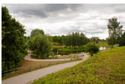
2 место Псков, Дендропарк 1804 голоса