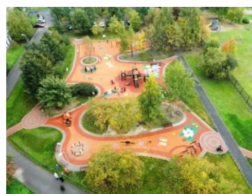
3 место Санкт-Петербург, МО Юнтолово 559 голосов